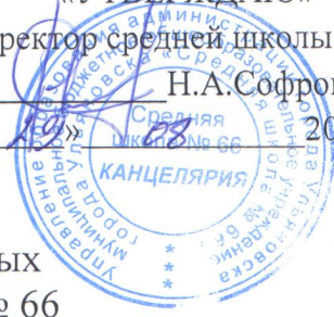
Схема расположения спортивных и игровых площадок на территории средней школы № 66

«УТВЕРЖДАЮ» Директор средней школы № 66 Н.А. Софронова « 28 » 08 2022г.