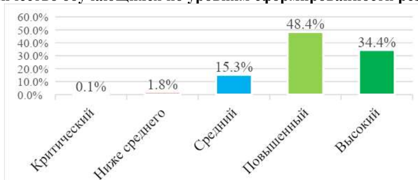
Количество обучающихся по уровням сформированности результатов

Наименьшие показатели по направлениям «Экологическое воспитание» и «Эстетическое воспитание».